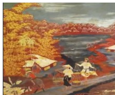
INDOCHINE CHAPITRE 21