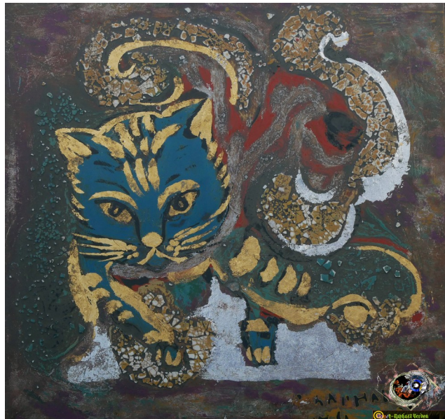
Chaton bleu (20x20 Laque poncée, 2014)

https://www.facebook.com/raphael.verdon.509