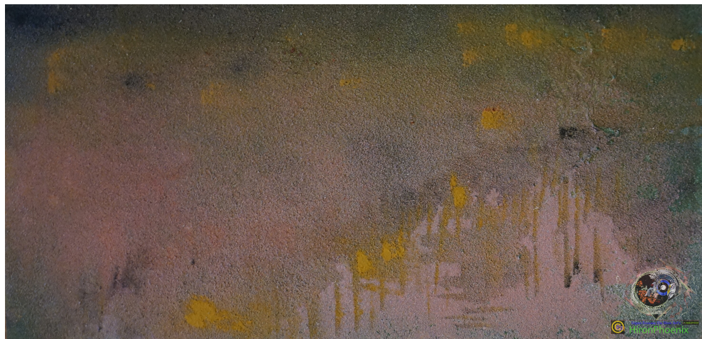
Attente tranquille (30x60 Technique mixte à base de sucre sur Support Bois, 2015) 650€