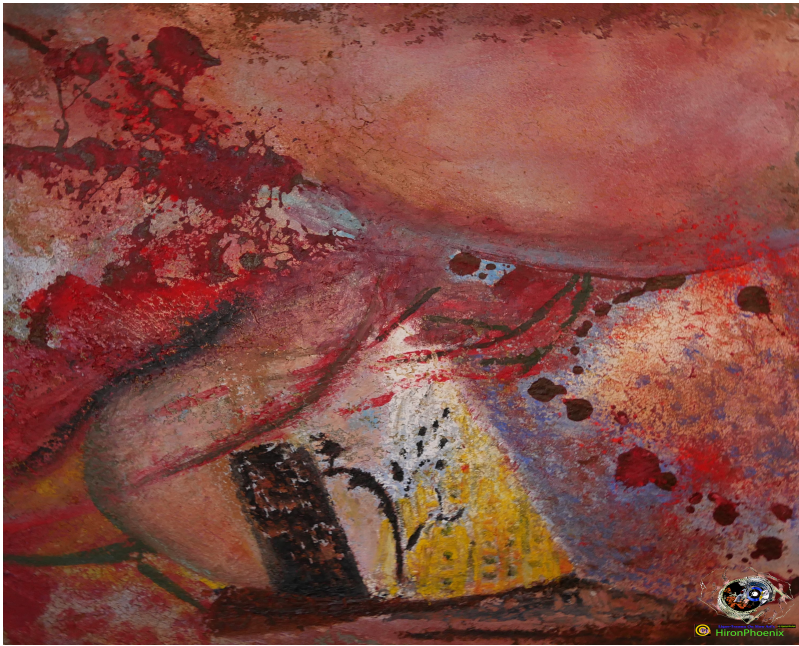
Quatre Eléments (50x50 Technique mixte à base de sucre sur support bois, 2016) 650€