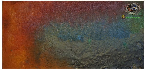
Fleuve d'Ambre (20 x40 Technique mixte à base de sucre sur support bois, 2015) 600€