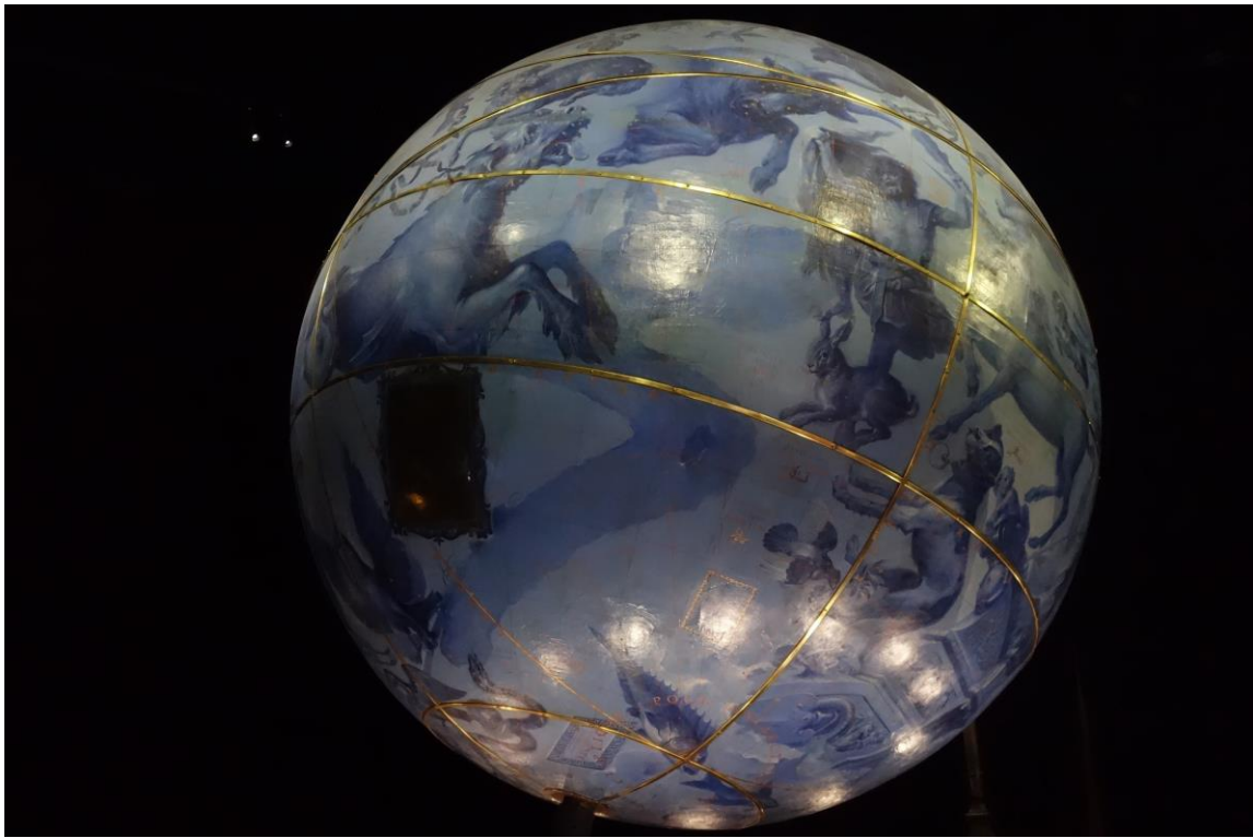
Le globe céleste de Coronelli fabriqué pour Louis XIV (1683) (4 m de diamètre)